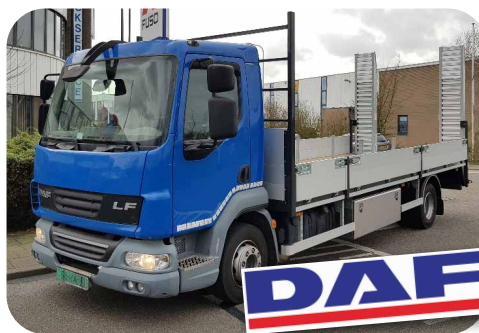
DAF LF 45.12.180 Oprijlaadbak machinetransport, bouwjaar 2012