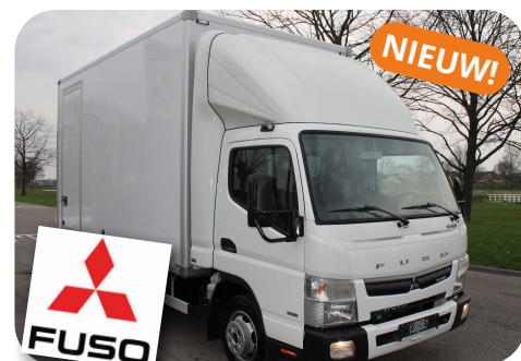
Fuso Canter 3C15 Bak met laadklep