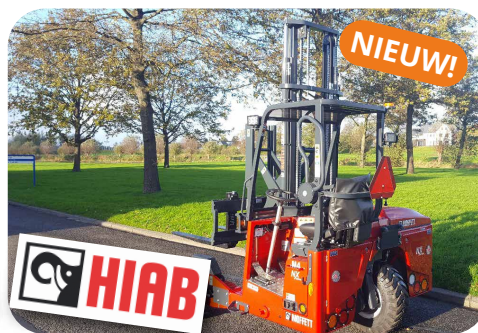
Moffett M4 25.4