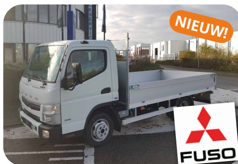
Fuso Canter 3C13 / 280 Open laadbak