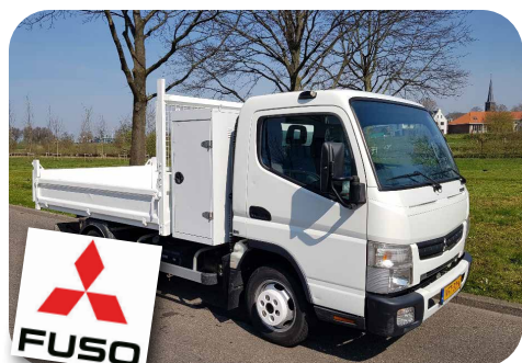
Fuso Canter 3C13 Kieplaadbak, bouwjaar 2014