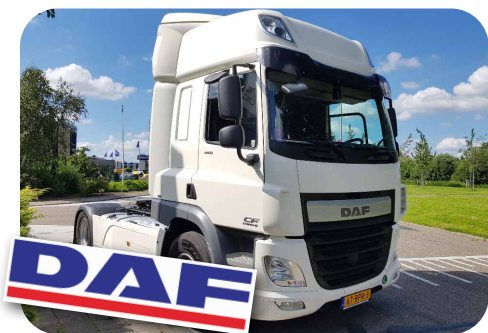
DAF FT CF440 Spacecab 4.2 trekker, bouwjaar 2016